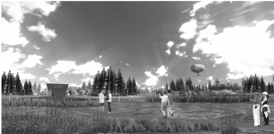
图4 水八仙花园效果图

农乐园主题策划为“农业大观,田园畅玩”:该区主要是对农耕历史文化、农业高科技的展示,景点设置中不仅有高科技农展馆、农耕历史文化长廊、微缩版垂直农场,还有现实版的QQ农场、都市菜园等,满足人们亲近田园、体验劳作的梦想,用景观的创新手法表现综合的农业文化展示与互动体验。