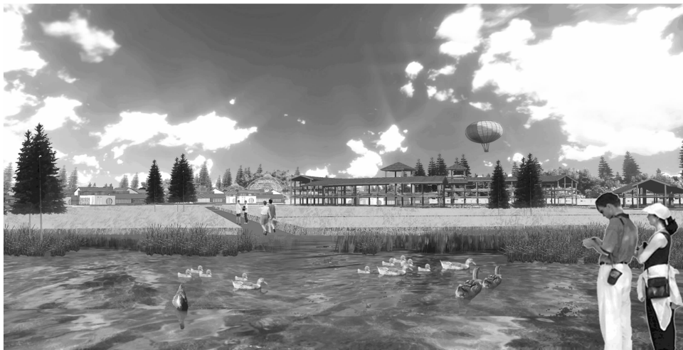
图3 鸭稻萍示范田效果图