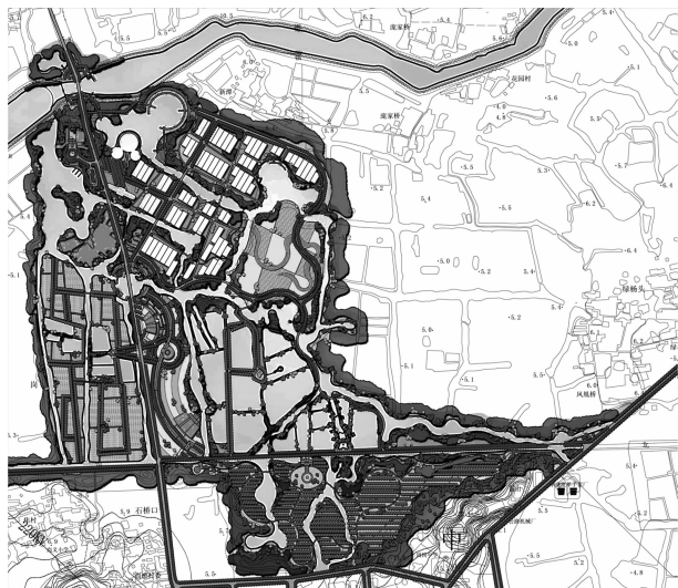
图1 湖熟农业大观园总平面图

规划区位于南京市江宁区湖熟街道,规划红线内面积 300 hm 2 ,地处江宁、溧水、句容 3 县(区)交界处,位于风景秀美的南京南郊、秦淮河畔,距南京市主城区仅 20 km,区位优势明显,水、陆、空交通方便。农业大观园为规划区的核心设计范围(图 1),秉承“建设特色产业、发展品牌农业、带动生态旅游”的理念,发展休闲观光农业,突出园区的农业展示、科普教育、生态旅游、休闲体验、示范带动功能,集合湖熟农业典型资源特色,打造高端、精致、特色的农业示范区。