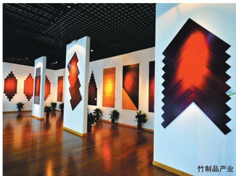
图2 宜兴市太华镇竹文化与竹制品推广展览

政府在转型发展中要发挥积极作用,如加强村镇规划、基础设施建设、环境保护、污染治理、社会保障体系建设、高效及低污染的城镇交通网络建立等,才能实现人口、资源、经济、环境和社会多方面协调、平衡发展的模式,在此过程中须强调资源的节约及城镇的宜居度。只有良好的生态和人文环境才能促进经济转型 [10] 。