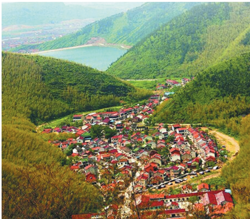
图3 宜兴市太华镇的生态旅游产业

中央农村工作会议指出,新型城镇化“核心是以人为本,关键是提升质量,工业化、信息化、农业现代化和城镇化同步发展。城镇化是现代化的必由之路,是解决“三农”问题的重