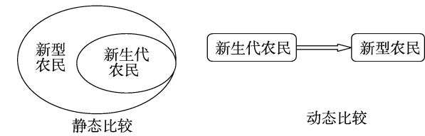
图1 新生代农民和新型农民的静态和动态过程

农业现代化是我国现代化进程的重要部分,农民发展能力是制约我国农业现代化发展的要素之一。改革开放后,由于我国城乡二元经济结构的差距,我国出现了大量的劳动力转移。张新民等在劳动力大量转移背景下,从农民数量萎缩、机构失衡、素质堪忧、后继乏人 4 个方面提出“农民荒”的概念,并认为“农民荒”成为制约我国农业现代化的重要机制 [11] 。如何解决农村劳动力不足及出现的“农民荒”现象逐渐成为研究的热点。高原等指出,提高新生代农民的自身发展能力,将新生代农民当成新型职业农民发展的主力军,使其立志于农业发展和农村建设,并且以务农为主要职业,做有文化、会经营、懂技术、讲文明、守法规的新生代农民是解决“农民荒”问题的主要方法 [7] 。