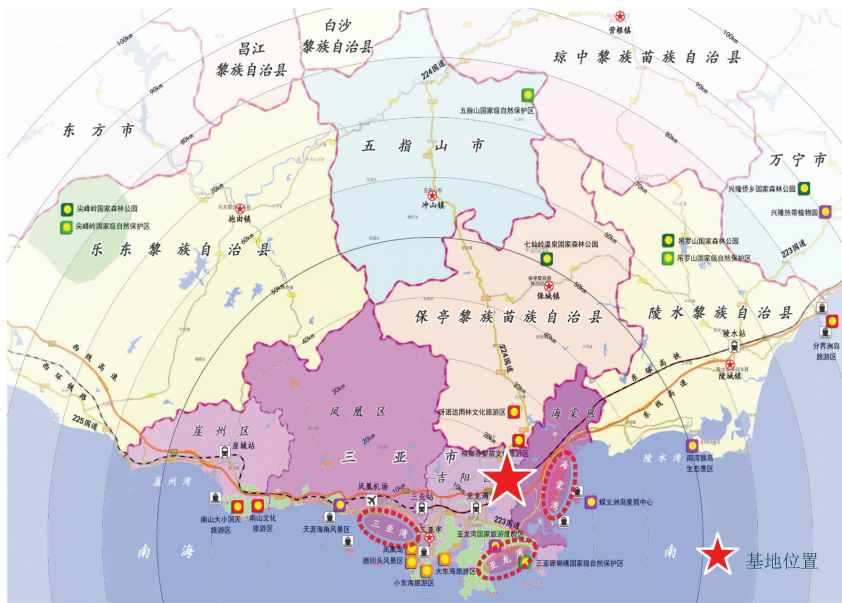
图2 中寥村区位分析

素。旅游公共服务设施不足会导致留不住游客,同时也会使当地居民和游客因争抢公共服务资源引发矛盾。