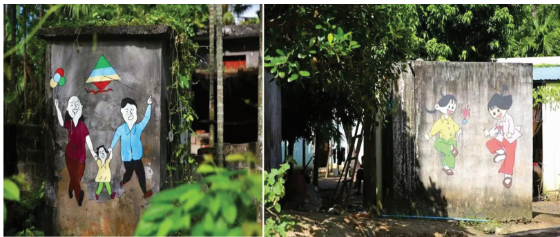
图4 中廖村的墙面涂鸦

系,既有交流,又互不干扰。传统的乡村格局在转型农业旅游的过程中,由点状分散式布局向条状整体式转型。