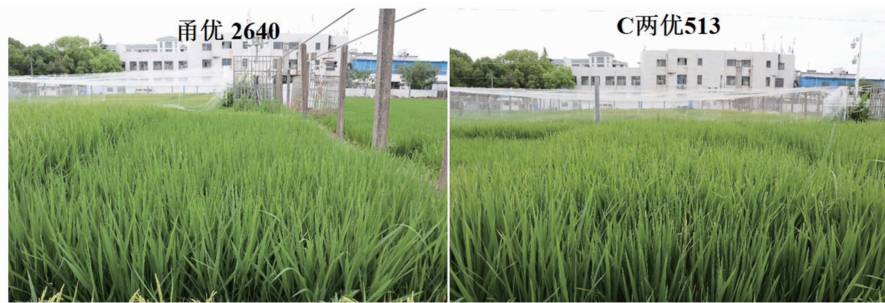
图1 水稻品种甬优 2640 和 C 两优 513 拔节期的田间群体形态

质日生产量达 236 \text{ kg}/\text{hm}^2 , 显著高于一般品种 C 两优 513 的 146 \text{ kg}/\text{hm}^2 [8] 。高效生产水稻群体一般表现为“早发、中稳、后优”, 即分蘖早发, 中期生长较为均衡、无效分蘖少, 后期灌浆持续较优, 进而获得丰产高效的结果 [9-10] 。图 1 为甬优 2640 和 C 两优 513 在常规施氮量条件下拔节期的田间照片。从图